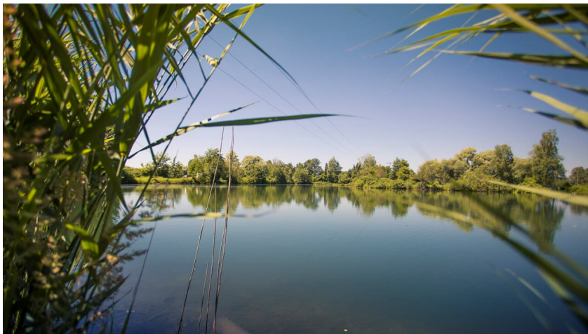
Wasserspiele - FouadVollmer