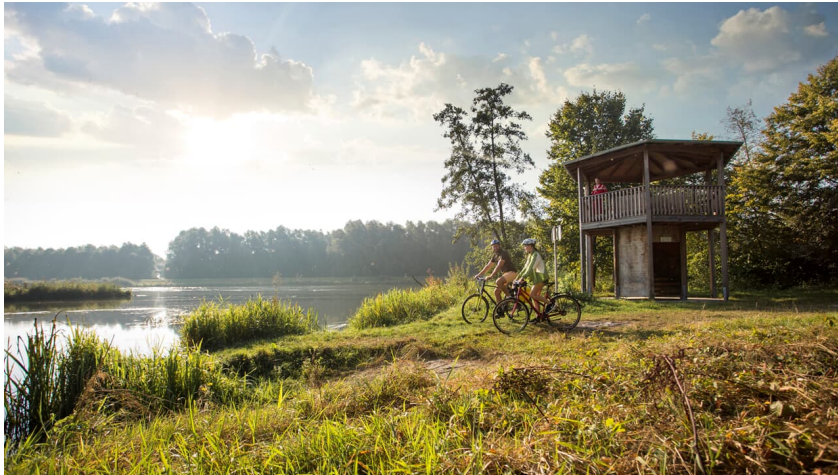
Grüner Thronsaal - FouadVollmer