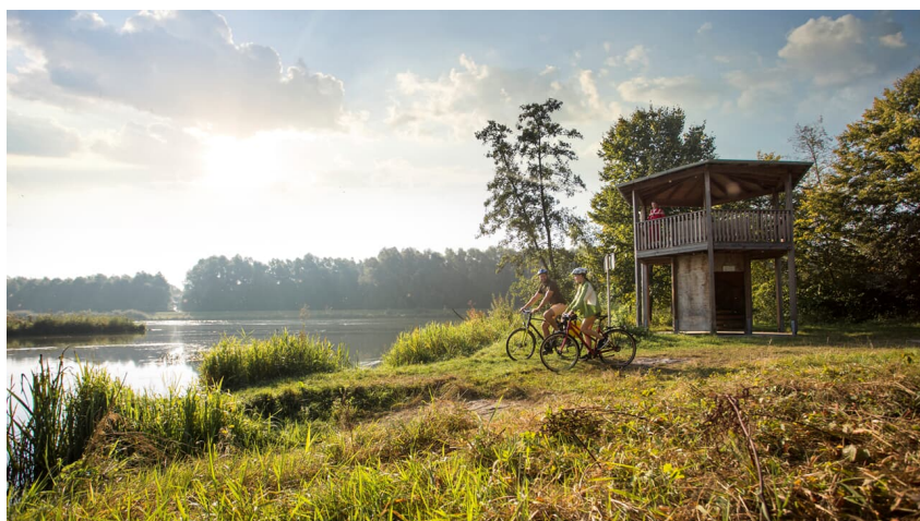
Grüner Thronsaal - FouadVollmer