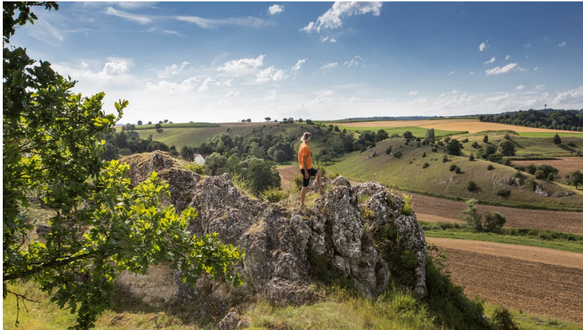
Wildfang - FouadVollmer