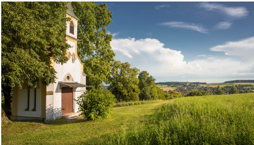
Heideterrasse - FouadVollmer