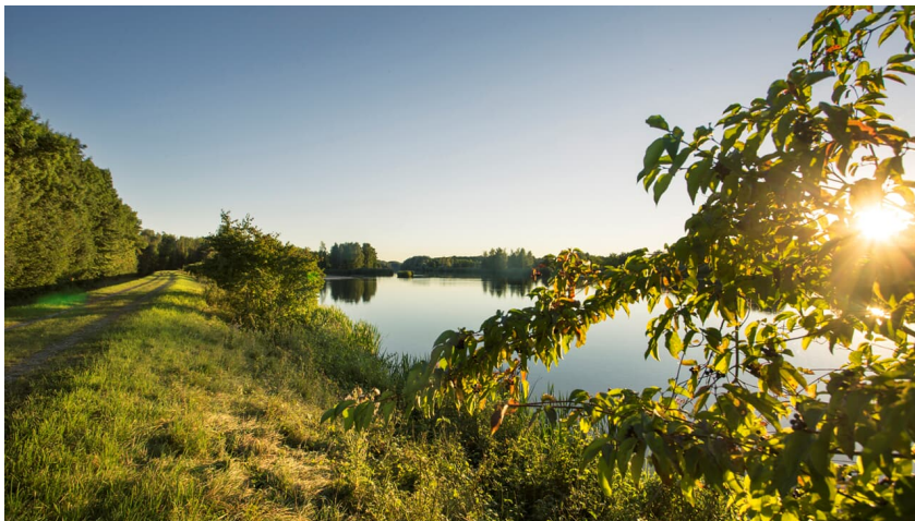
Donautäler - FouadVollmer