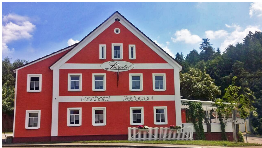
Löwenhof Landhotel & Restaurant