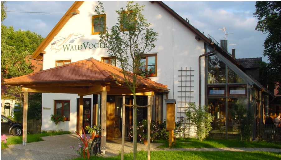
Waldvogel-Frontansicht 300dpi (1).jpg

Der Waldvogel ist ein Ausflugslokal für Radler und Spaziergänger, für Besucher des Legolandes und für alle, die gutes und regionales Essen schätzen.