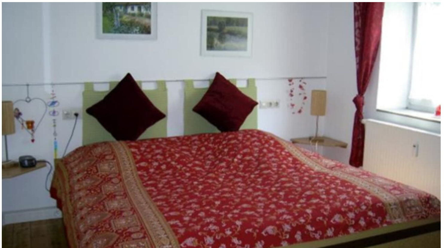
Ferienwohnung Weimann Dillingen Donau