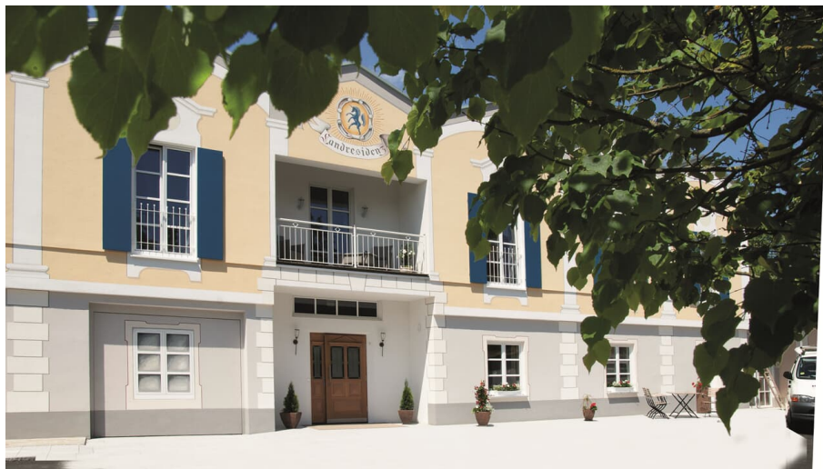
Außenansicht Landresidenz Zum Schloßle Finningen