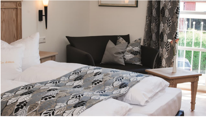
Doppelzimmer Landresidenz Zum Schloesse Finningen