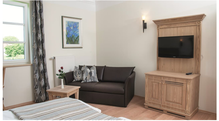
Doppelzimmer Landresidenz Zum Schloesse Finningen