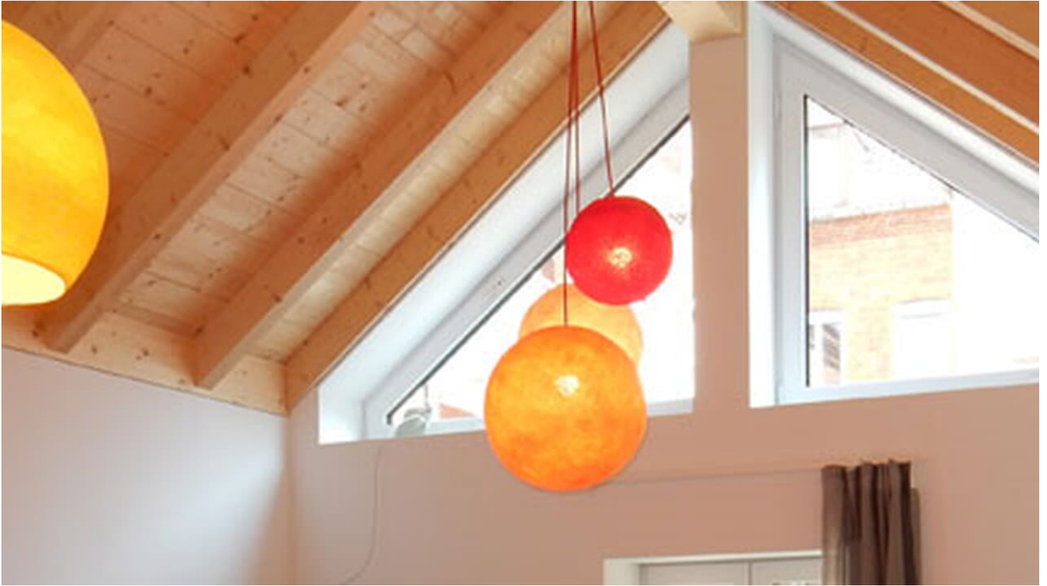
Brickstone Hostel