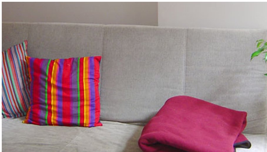
The Brickstone Hostel