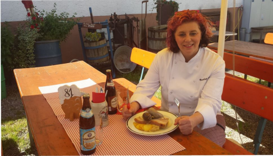
Gasthof Adler - Schlachttag