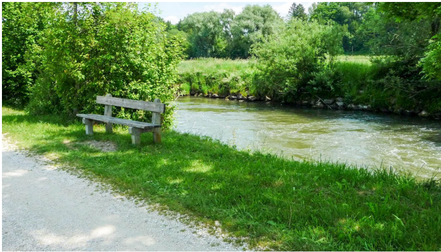
Angeln am Günztal