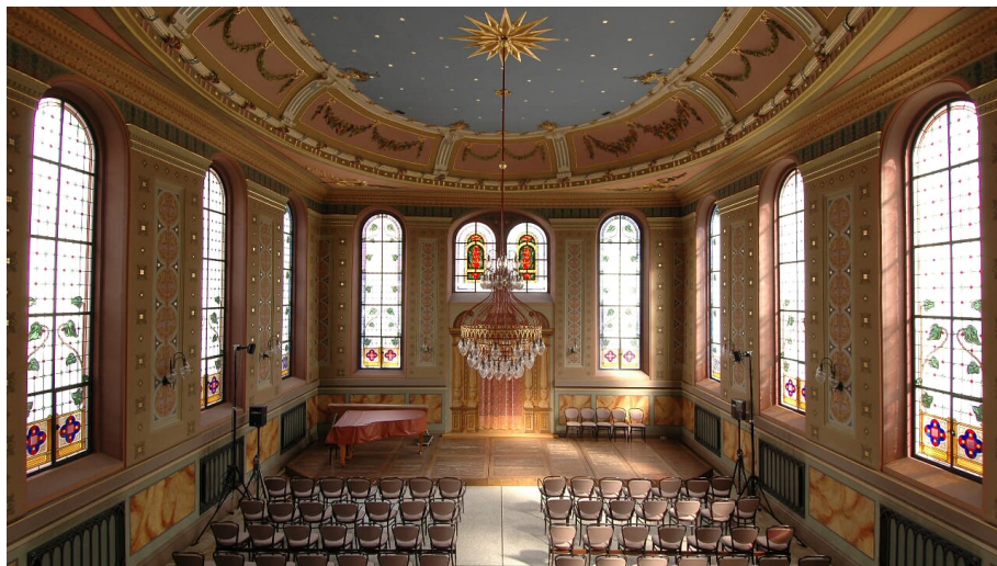
Synagoge von Innen - © Stiftung ehemalige Synagoge Ichenhausen