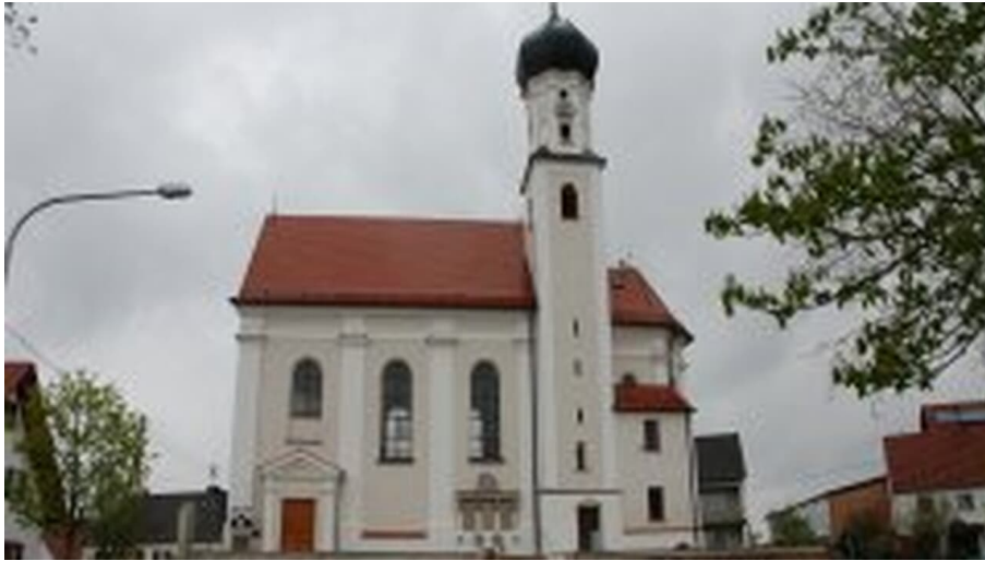
St. Peter und Paul