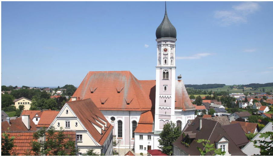
burgau_stadtpfarrkirche2_-c-peter-wieser - © Peter Wieser