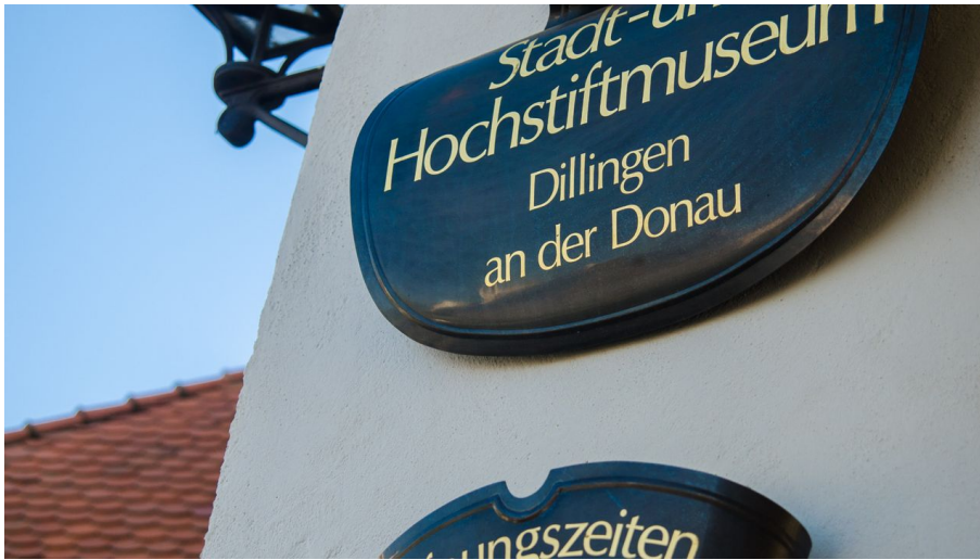
Stadt- und Hochstiftmuseum Dillingen