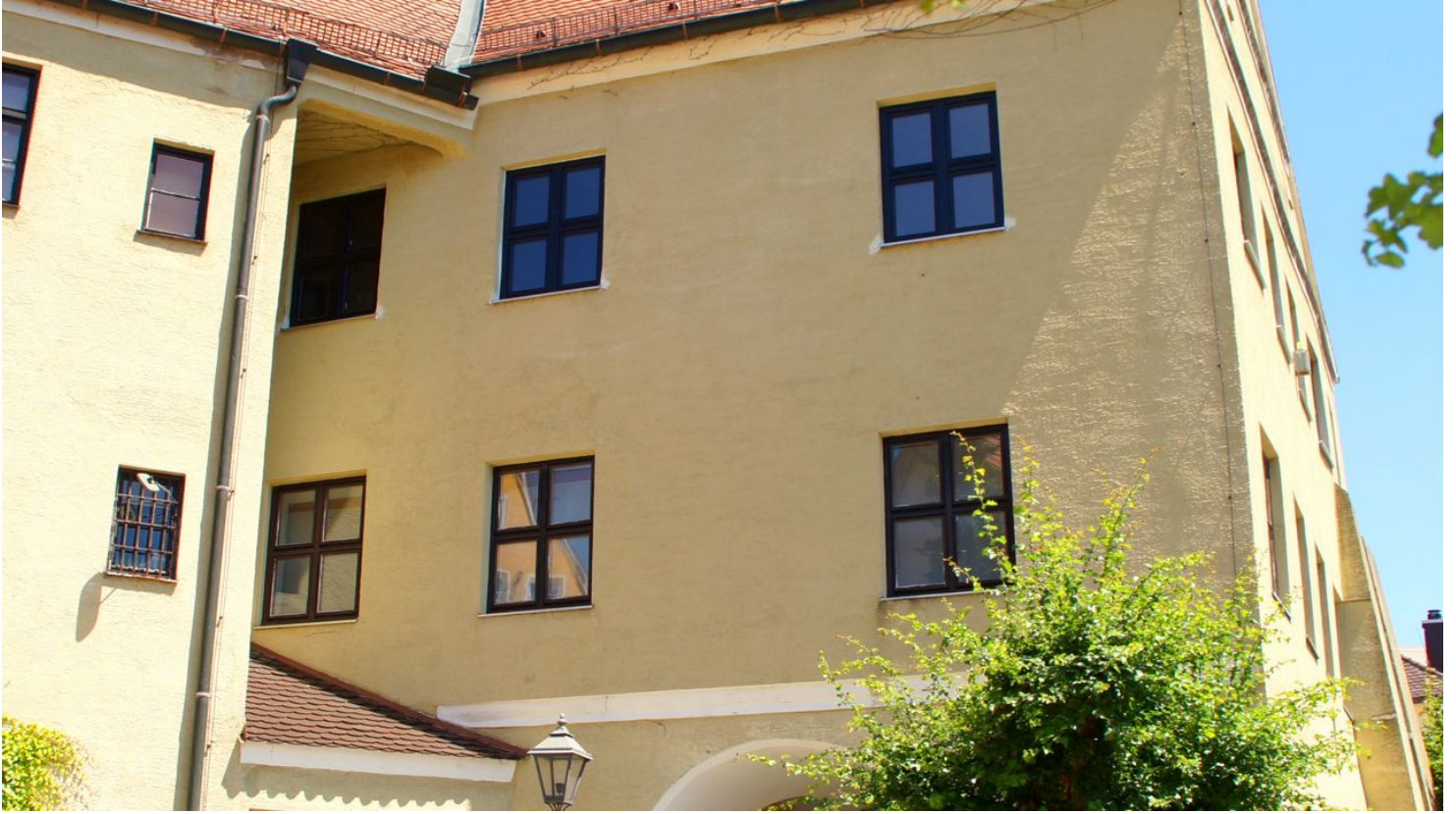
Stadt- und Hochstiftmuseum Dillingen