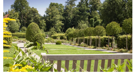
Klostergarten Roggenburg