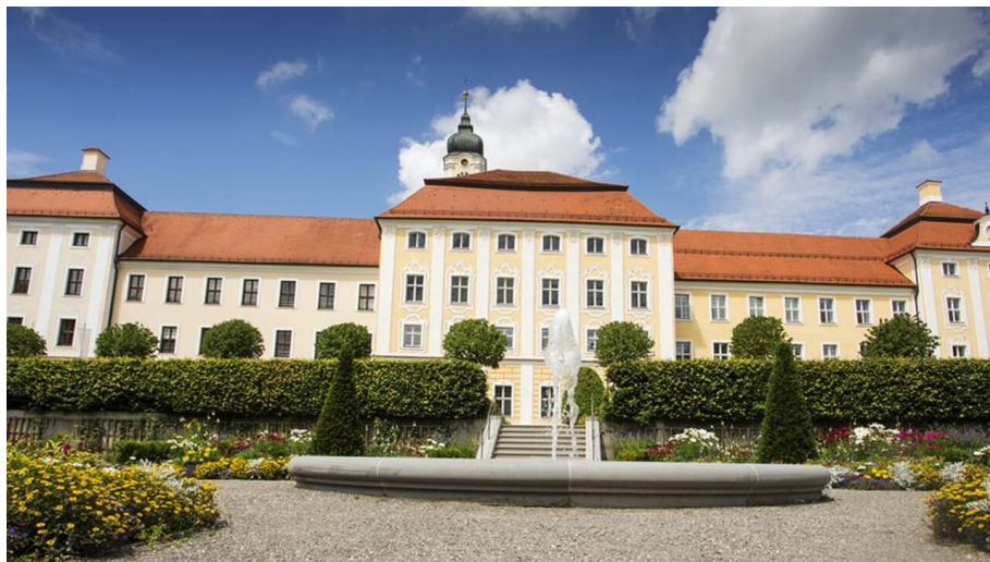
Klosteranlage Roggenburg