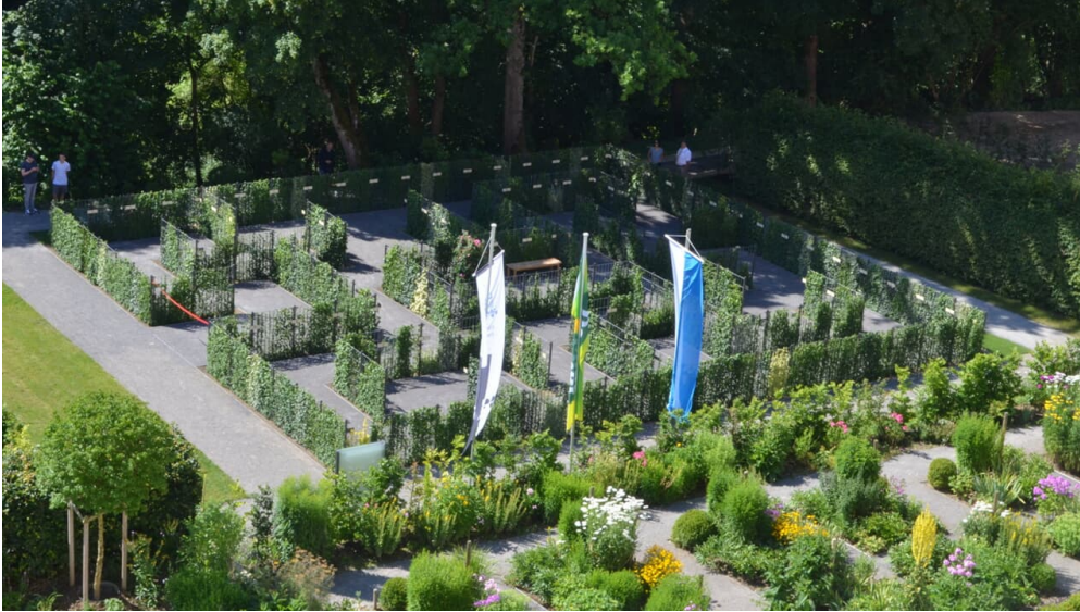
Meditationsgarten mit Efeu-Labyrinth