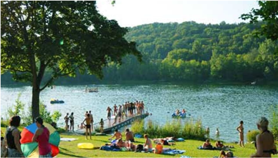
Pfuhler See - © Landratsamt Neu-Ulm