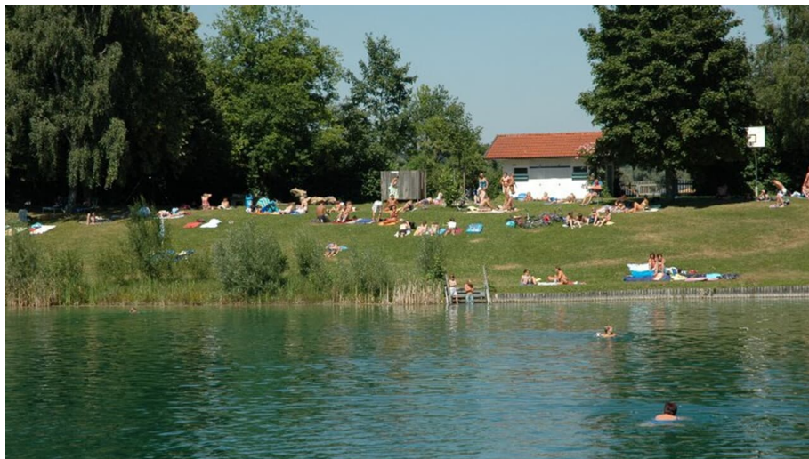
Auer Badesee