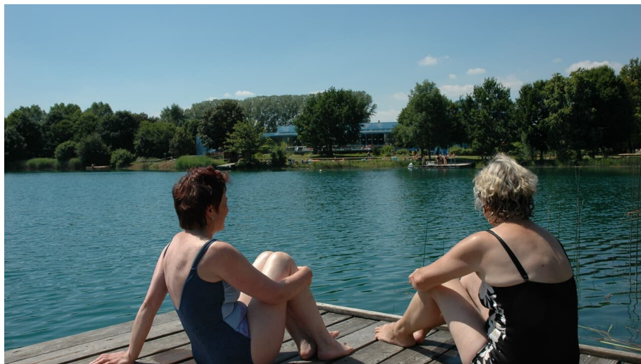
Sendener Waldsee