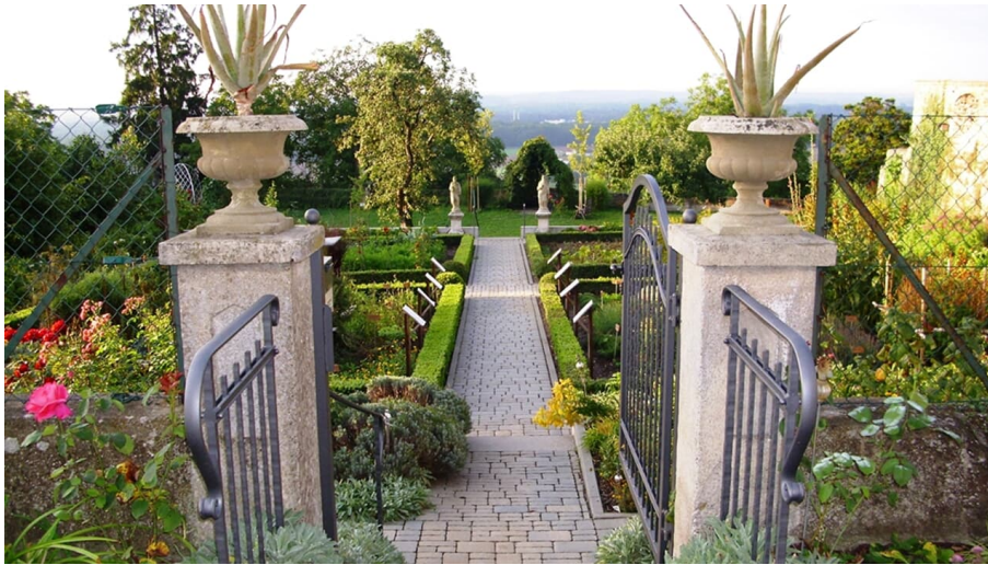
Klostergarten Oberelchingen