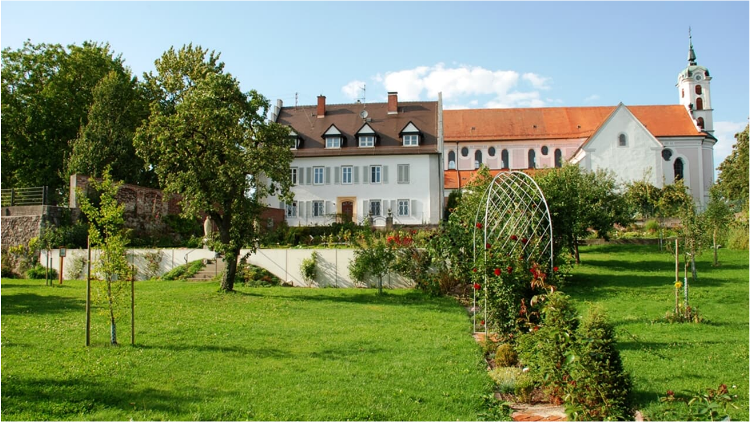
klostergarten-oberelchingen-mit-kirche-und-pfarrhaus-im-hintergrund-foto-daniel-huber - © Gemeinde Elchingen