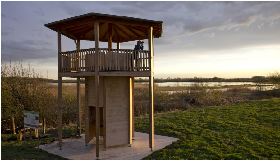
Beobachtungsturm Schurrsee