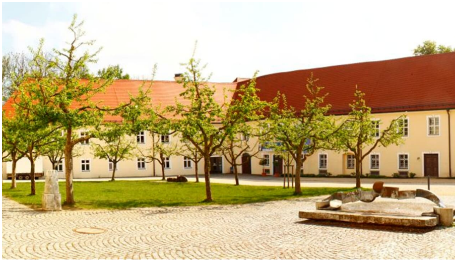
Haus für Kunst und Kultur beim Kloster Roggenburg