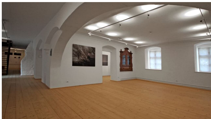
Haus für Kunst und Kultur beim Kloster Roggenburg