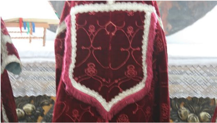
Sammlung Kloster Elchingen