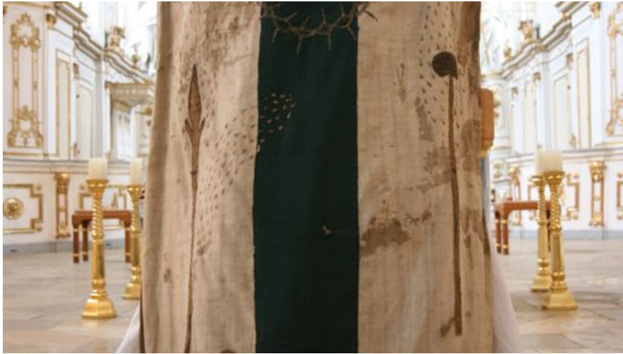
Sammlung Kloster Elchingen