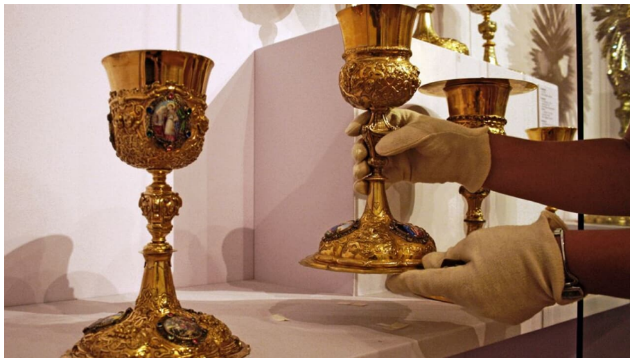
Klostermuseum Roggenburg