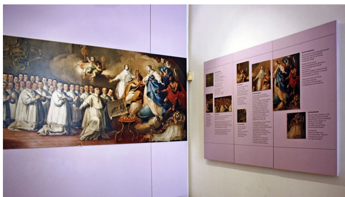
Klostermuseum Roggenburg