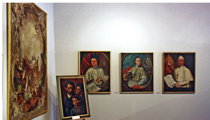
Klostermuseum Roggenburg