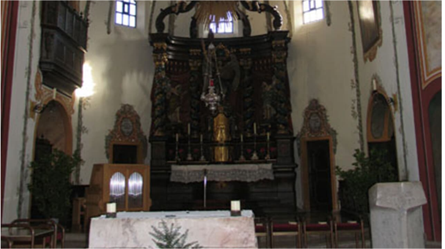
Pfarrkirche Sankt Michael