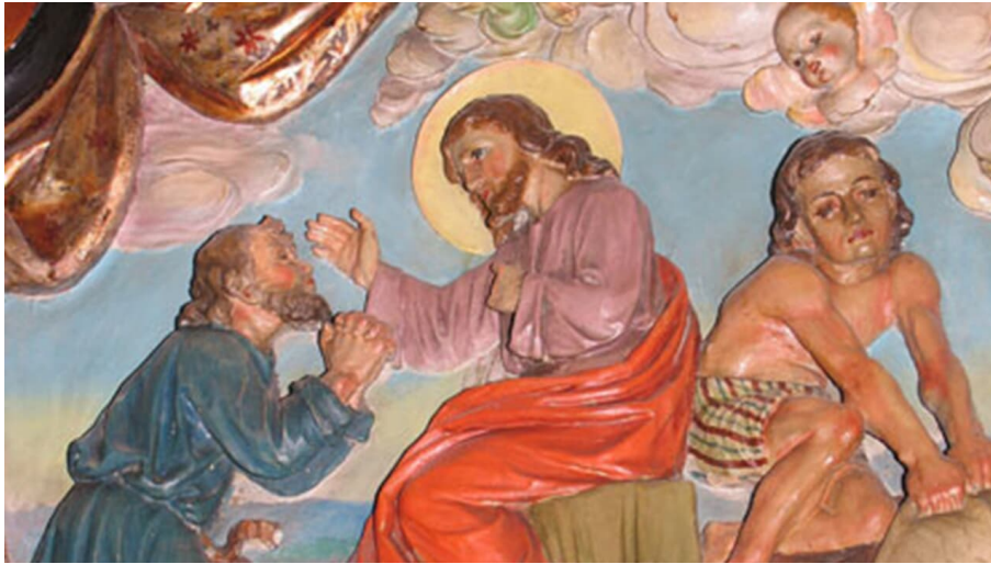
Pfarrkirche Sankt Michael