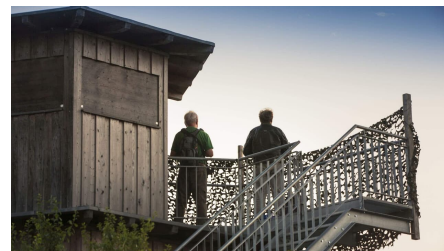
Vogelbeobachtung am Plessenteich in Neu-Ulm