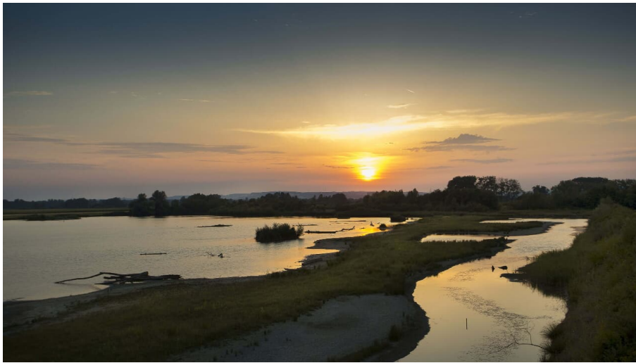
Vogelbeobachtung am Plessenteich in Neu-Ulm