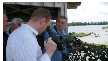
Vogelbeobachtung am Plessenteich in Neu-Ulm