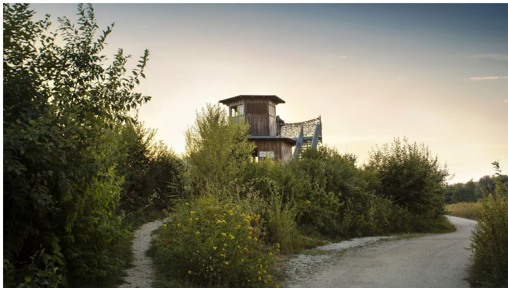
Neu-Ulm Plessenteich mit Beobachtungsturm