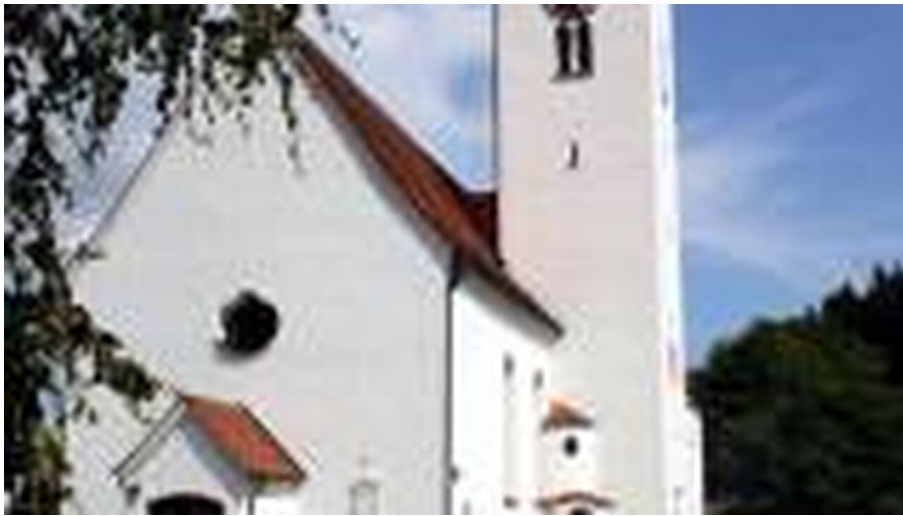
Kirche St. Sebastian und Ottilia