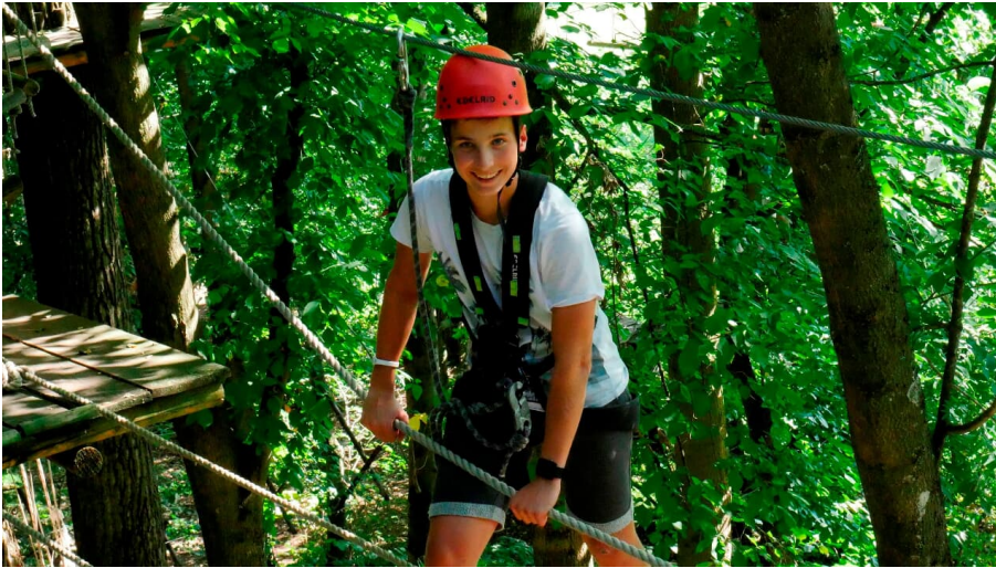
Waldseilgarten Wallenhausen