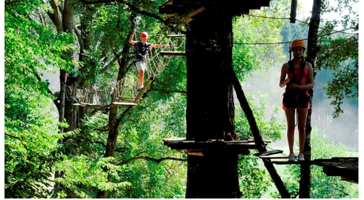
Waldseilgarten Wallenhausen