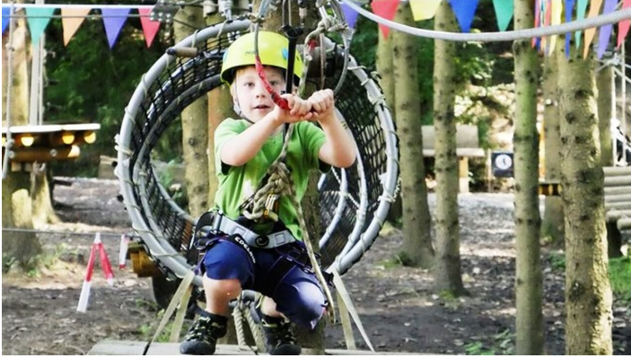
Waldseilgarten Wallenhausen