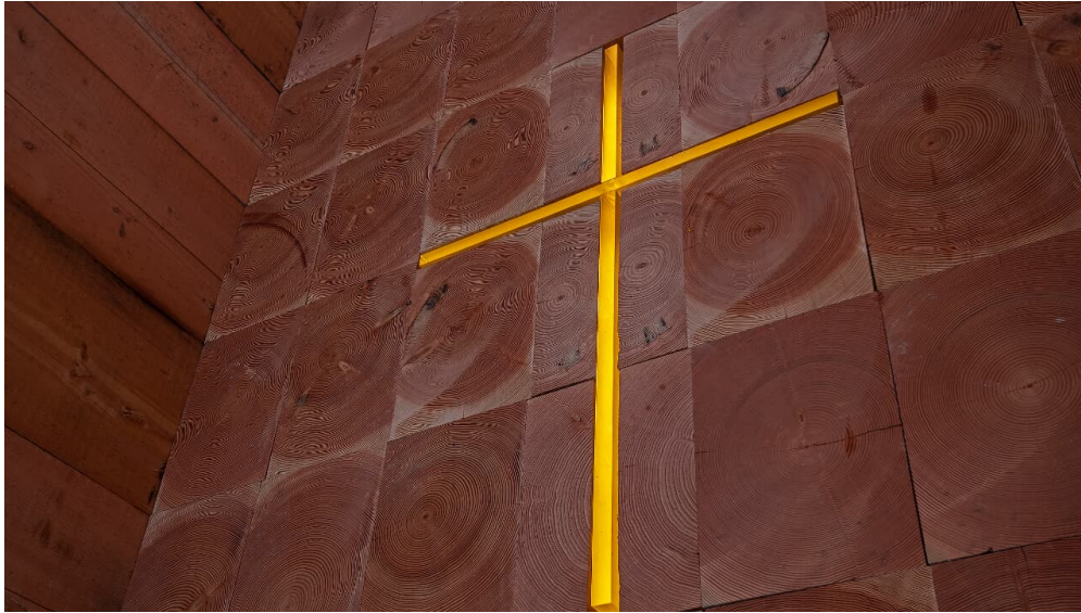
Wegkapelle Unterliezheim 2