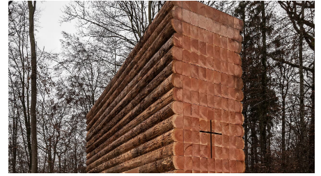
Wegkapelle Unterliezheim 3