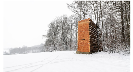
Wegkapelle Unterliezheim 4