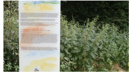
Nebelbachpark 4