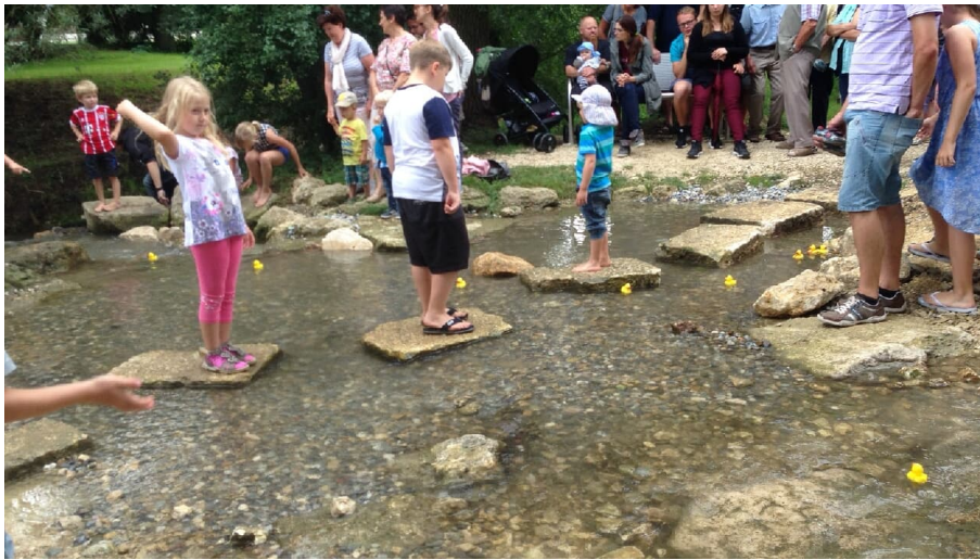
Nebelbachpark 1 - © Manuela Sing