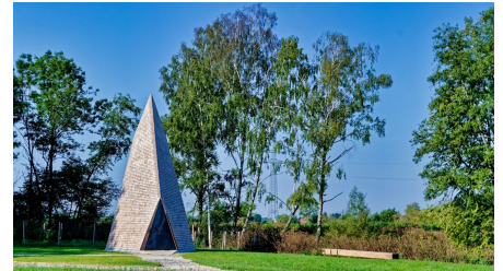
Wegkapelle an der Ludwigsschwaige