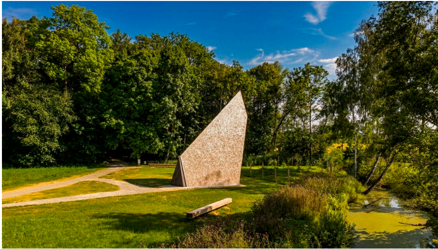
Wegkapelle bei der Ludwigsschwaige - © Eckhart Matthäus / www.em-foto.de