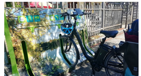
E-Bike-Ladestation am Dorfladen in Kellmünz