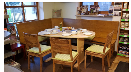
Dorfladen Kellmünz (Kaffeecke)