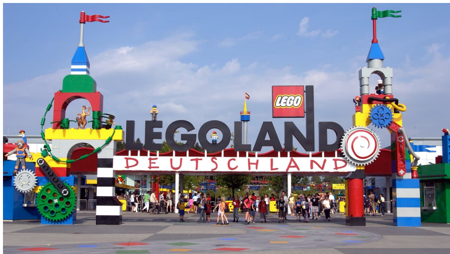
LEGOLAND Deutschland