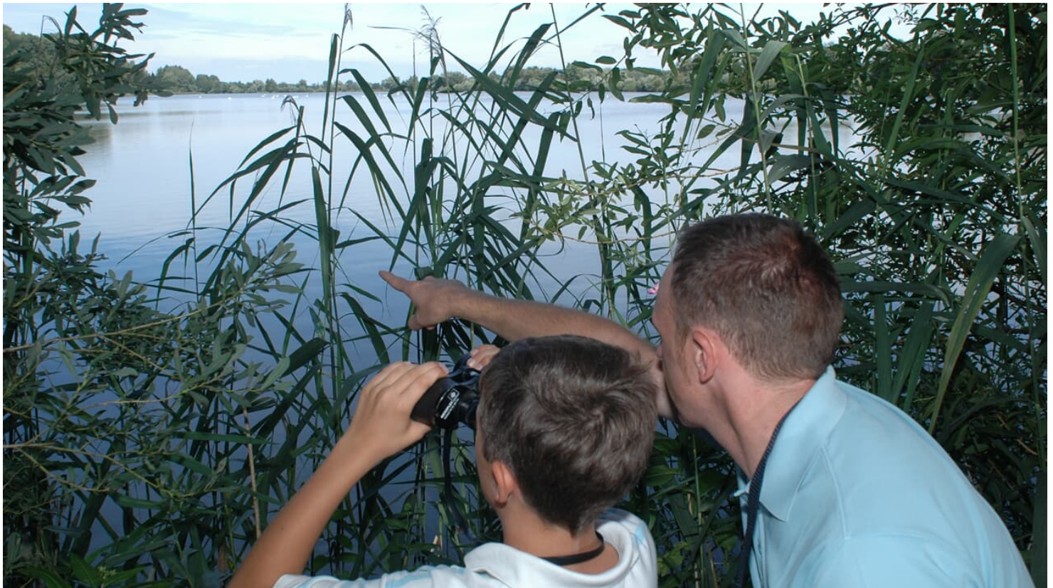
Tierbeobachtung Oberegger Stausee