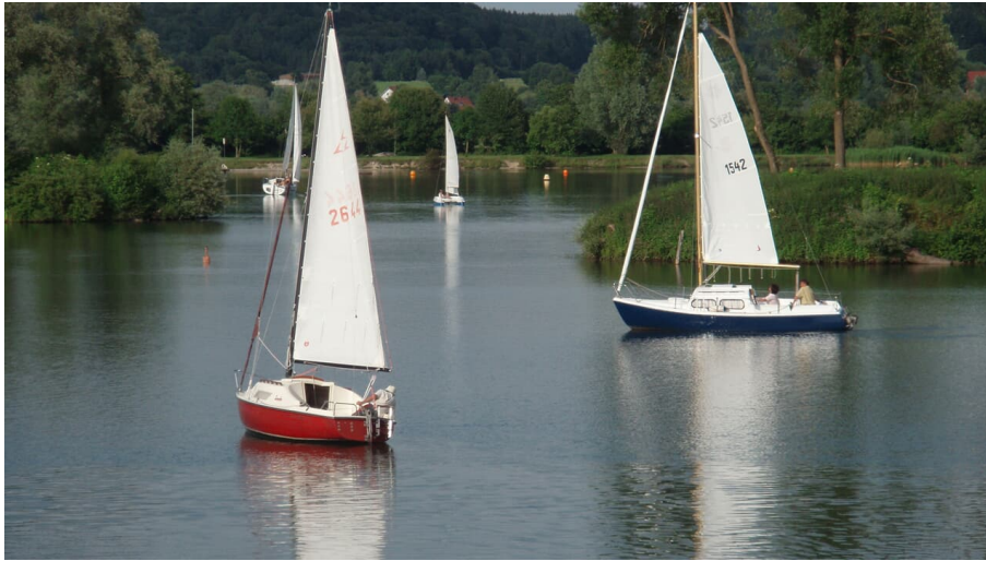
Oberrieder Weiher Segler und See