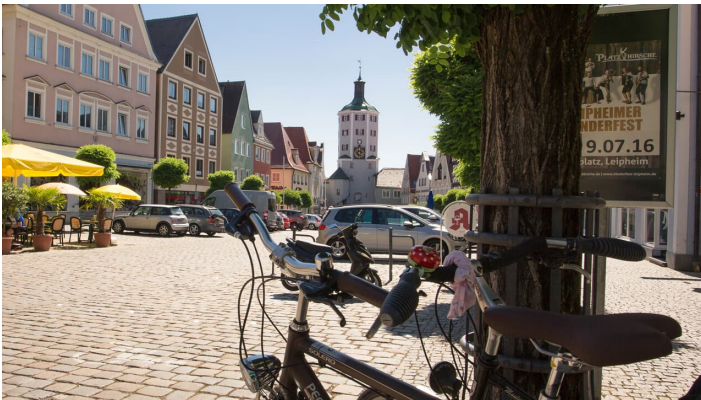
Marktplatz Günzburg