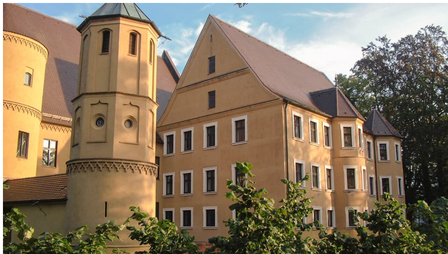
Schloss Wertingen - © Fouad Vollmer