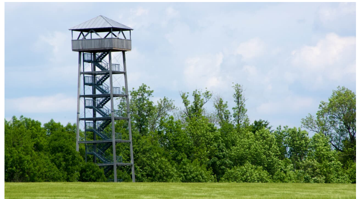
Aussichtsturm Offingen