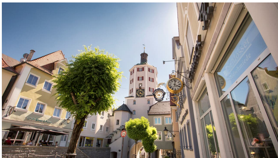
Innenstadt Günzburg