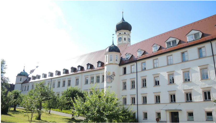
Kloster Ursberg