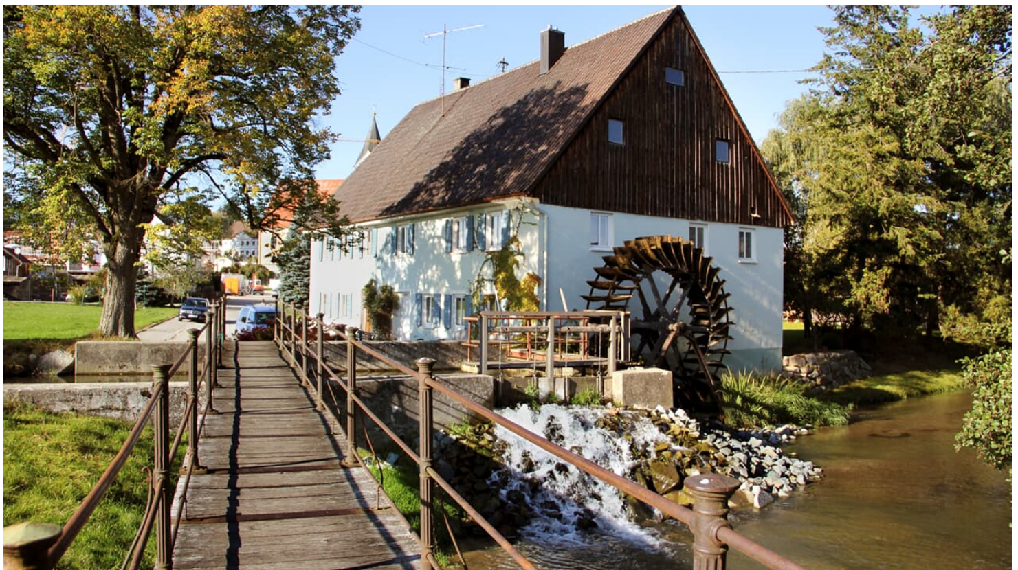
Zusammühle in Ziemetshausen