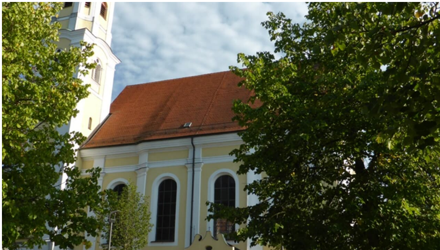
Maria Vesperbild