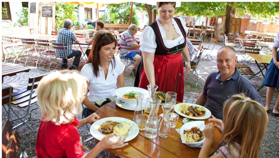
Hotel-Landgasthof Waldvogel, Leipheim