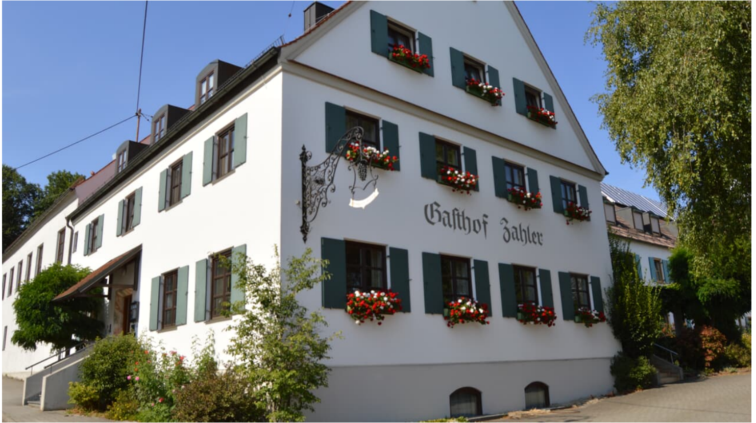
Gasthof Zahler, Röfingen