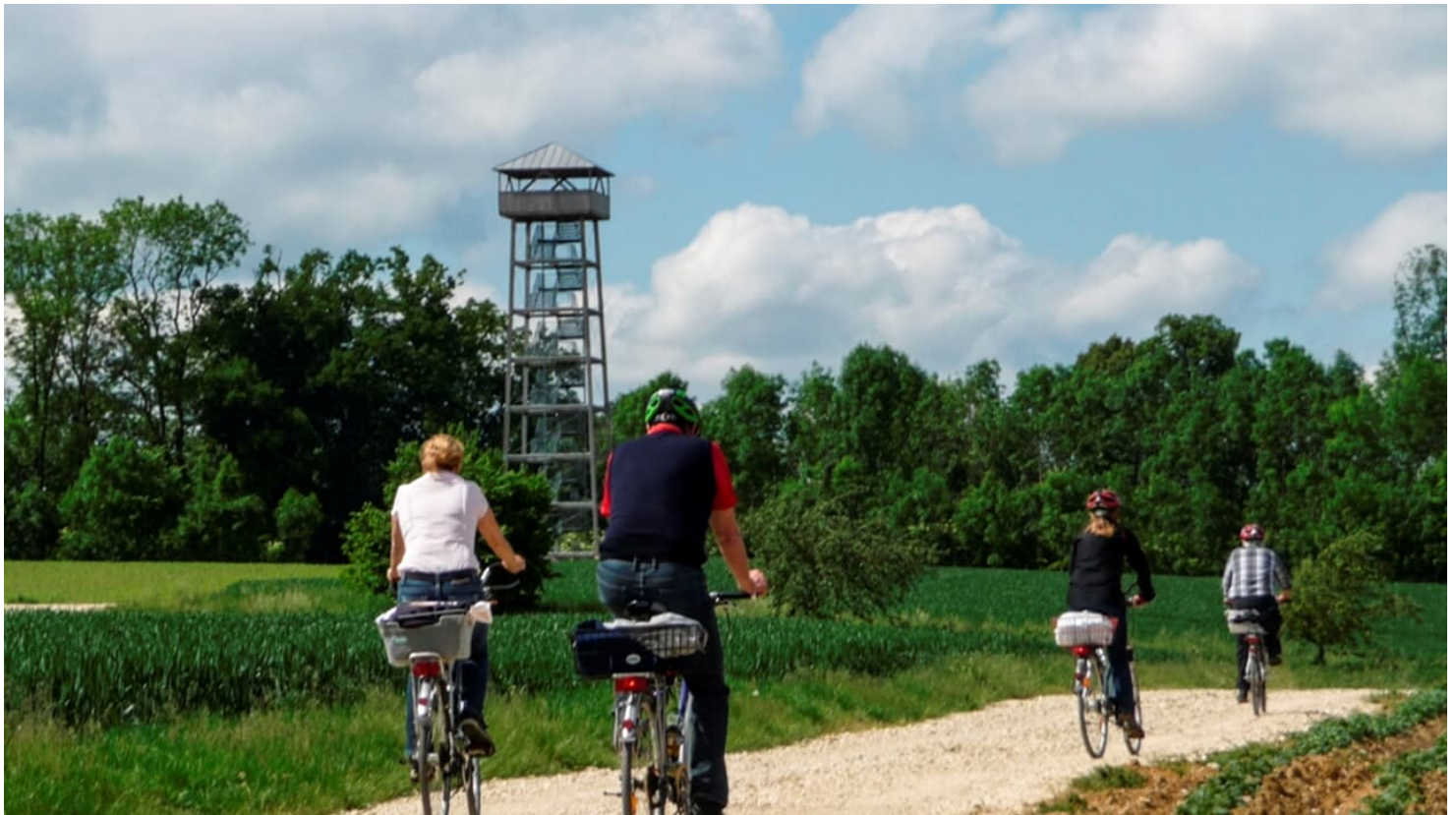
Via Danubia Laushtour