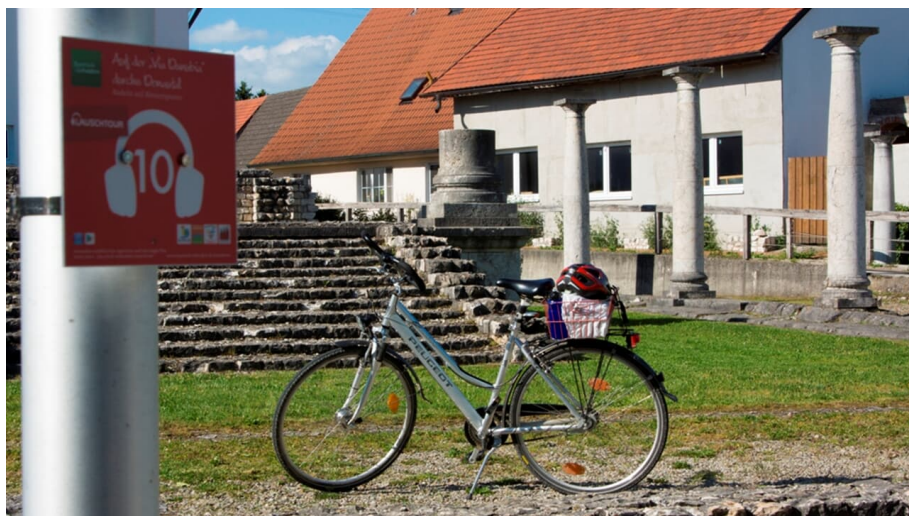
Via Danubia Lauschtour