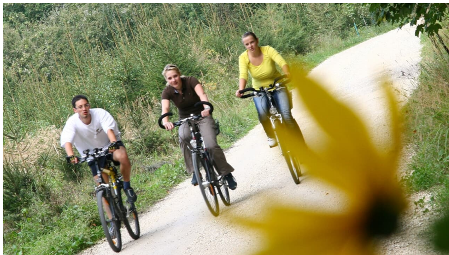
Berg & Tal