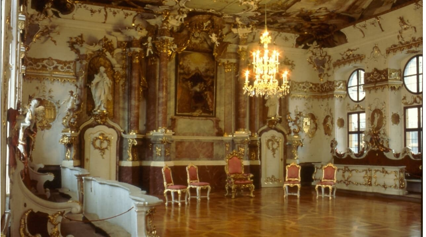
Goldener Saal Dillingen