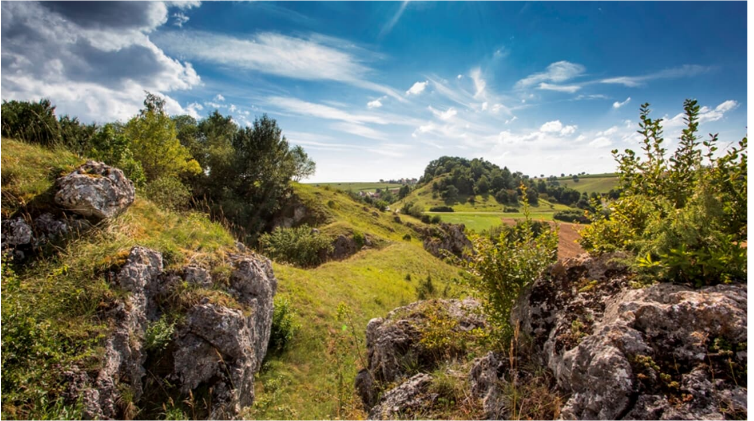
Fronhofen Riesrand - © Fouad Vollmer