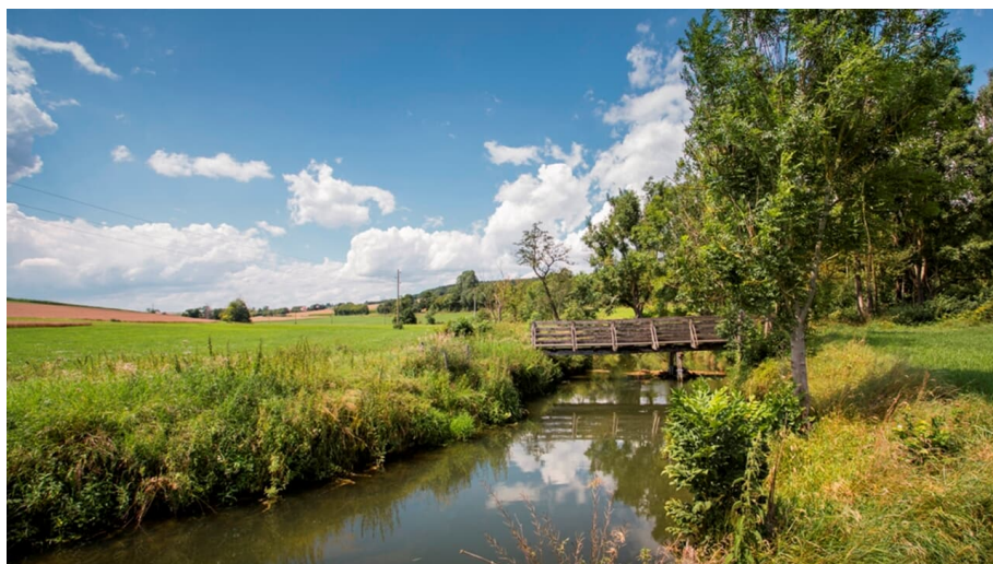
Kesseltal Aktiv Tour Bissingen