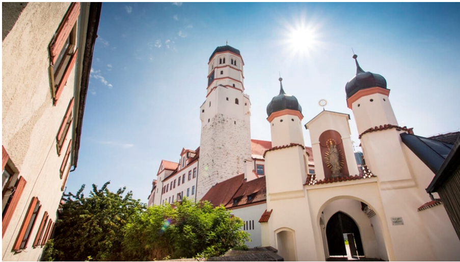
Schloss Dillingen - © Fouad Vollmer