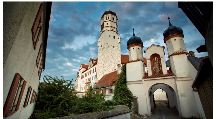
Rund ums Schwäbische Rom