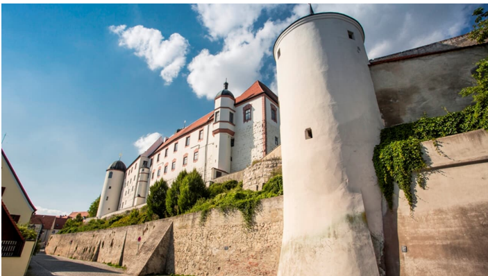
Schloss Dillingen