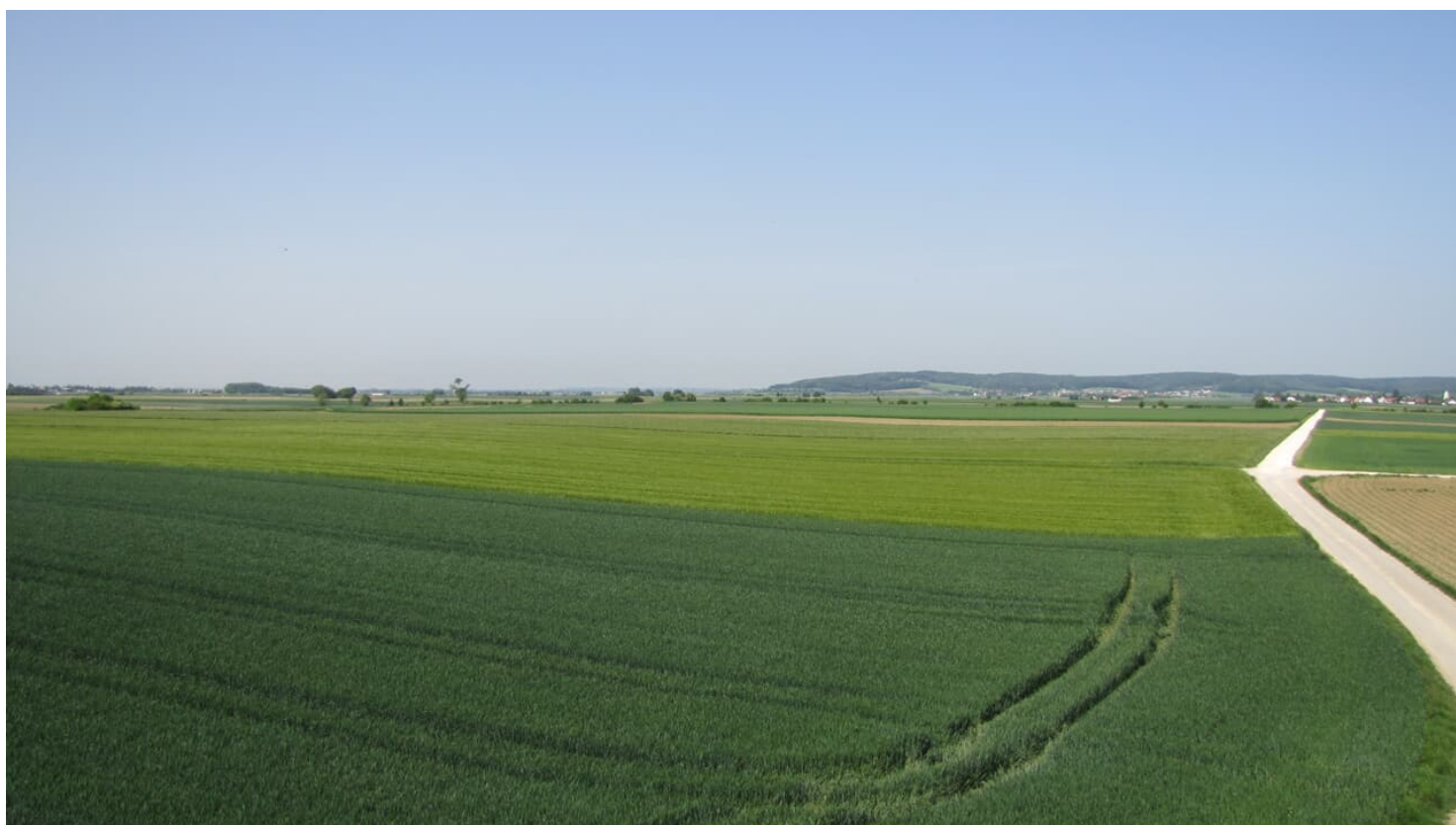
Denkmalweg - Blick auf das Schlachtfeld