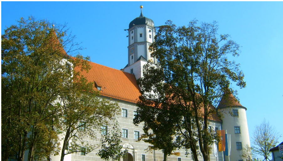
Schloss Höchstädt