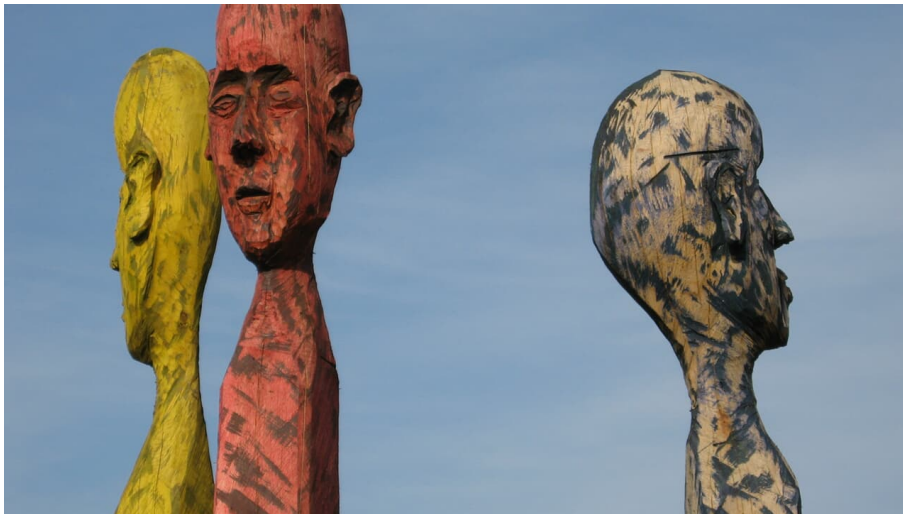
Skulpturenweg - © Fouad Vollmer