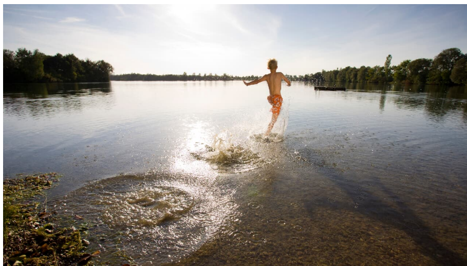
Schwäbisches Seenland