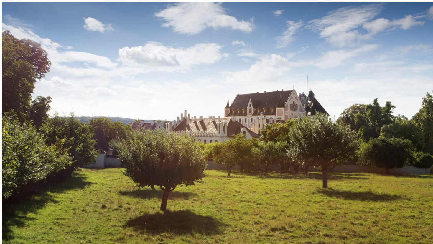
Dischingen Schloss Taxis