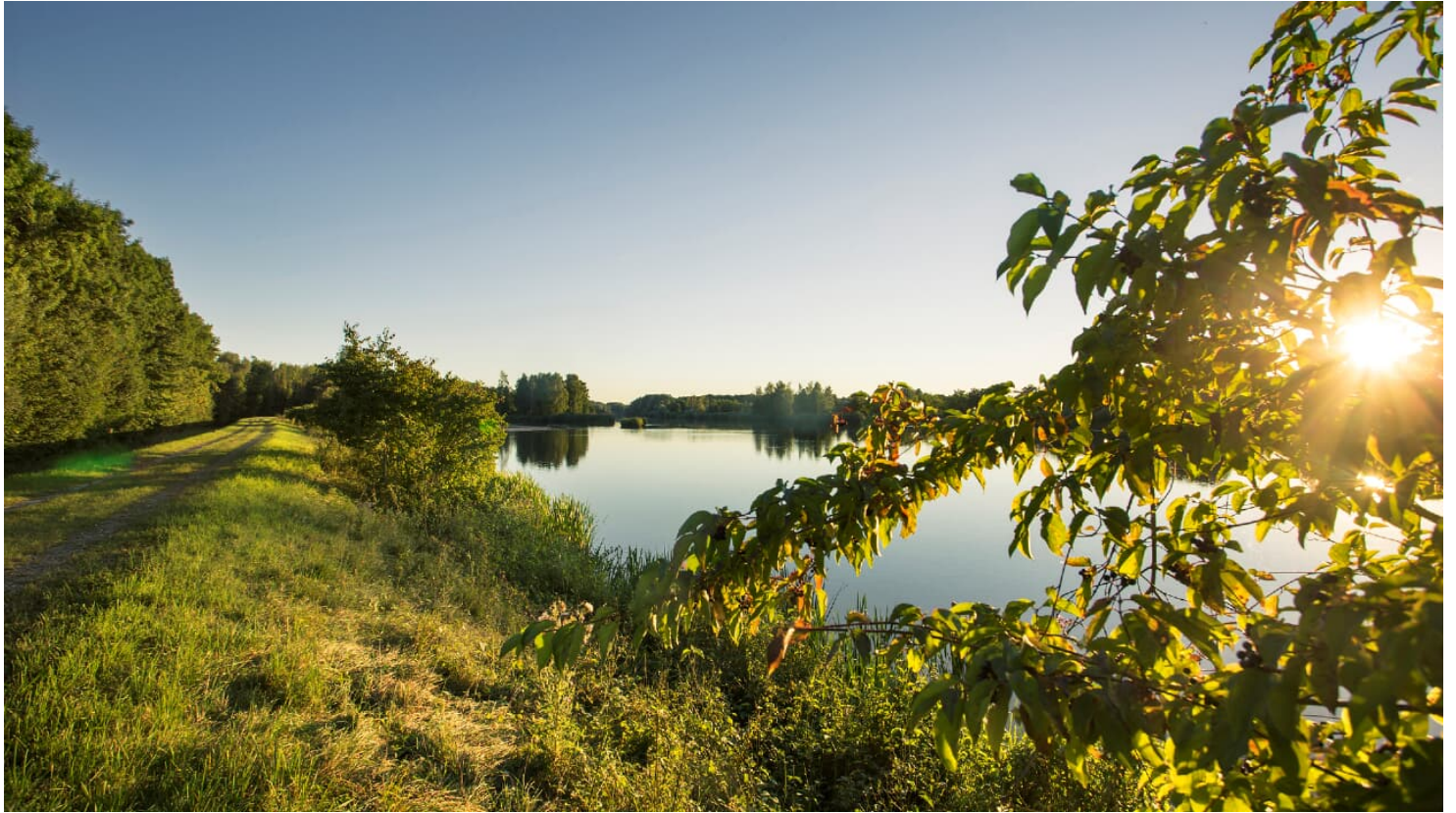
Donau bei Blindheim